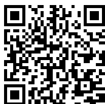
Verbali di protesta